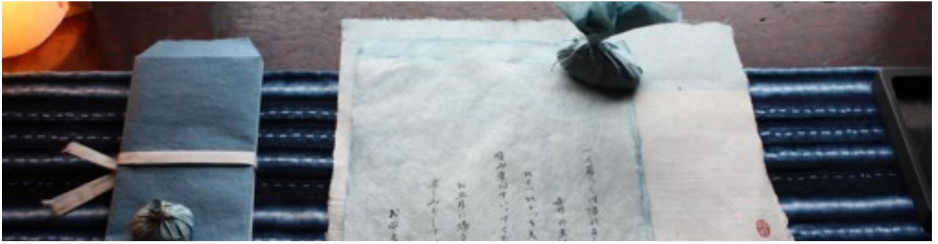
陽だまり保育園移転準備委員会 ニュースレター“Re” 最終回